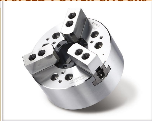
寸法図 ≧ Dimensions